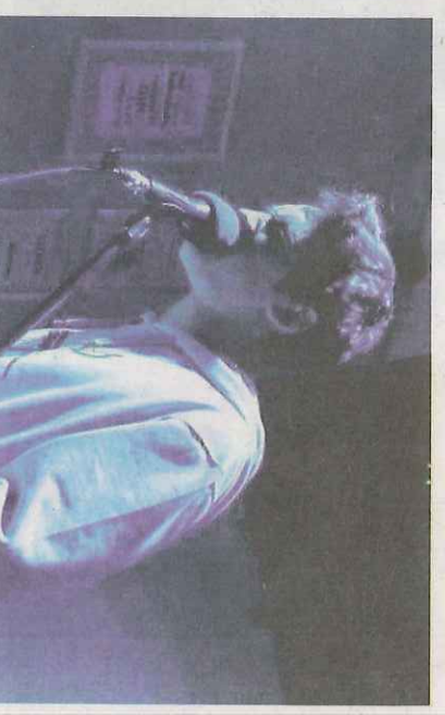
O jovem numa das suas atuações