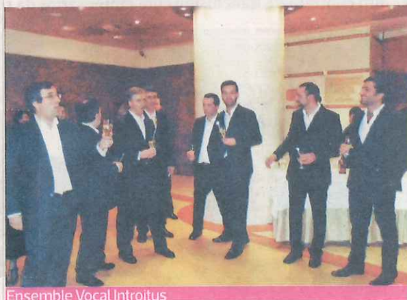
Ensemble Vocal Introitus