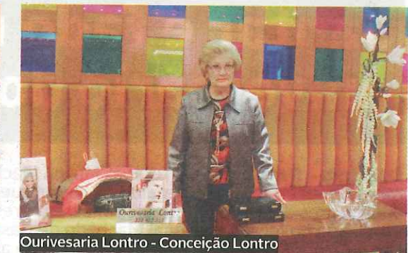
Ourivesaria Lontro - Conceição Lontro