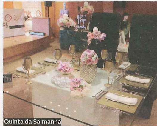
Quinta da Salmanha