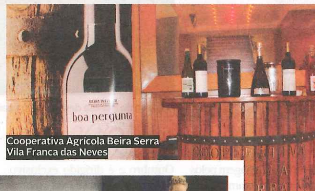
Cooperativa Agrícola Beira Serra Vila Franca das Neves