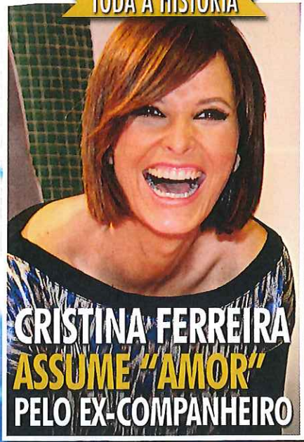
CRISTINA FERREIRA ASSUME "AMOR" PELO EX-COMPANHEIRO