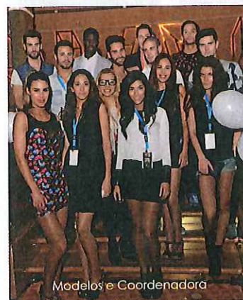
Modelos e Coordenadora