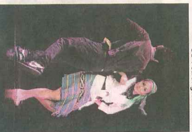
Mostra de dança