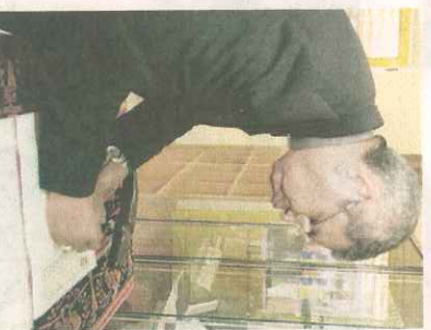
Ximenes Belo assinou